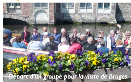
Départ d'un groupe pour la visite de Bruges

Pour tout renseignement et inscription : gerbepal.animation88@gmail.com