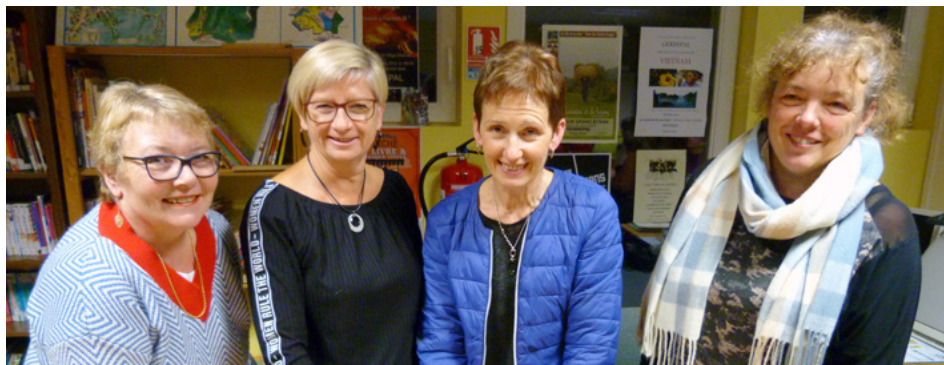
Le club de gymnastique d'entretien, fort de 29 membres